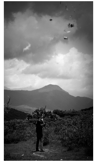
Who Knows Where the Time Goes , 2014 Video. 5'10" Colección del artista.

La pintura negra en la fotografía, un libro siendo pulverizado por municiones a toda velocidad o la mierda en el parabrisas pueden ser percibidas bajo las consideraciones anteriores, o también bajo una serie de explicaciones numéricas, en donde a partir del análisis de la materia, la velocidad y la probabilidad, podríamos entender una distinta “naturaleza” de las formas.