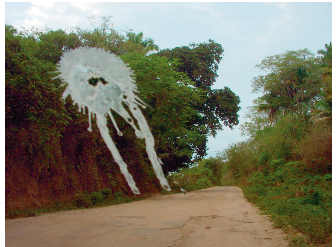
La mierda es un don del cielo , 2011 Impresión Glicée, 47 x 60 cm Cortesía Travesía Cuatro. Foto: cortesía del artista