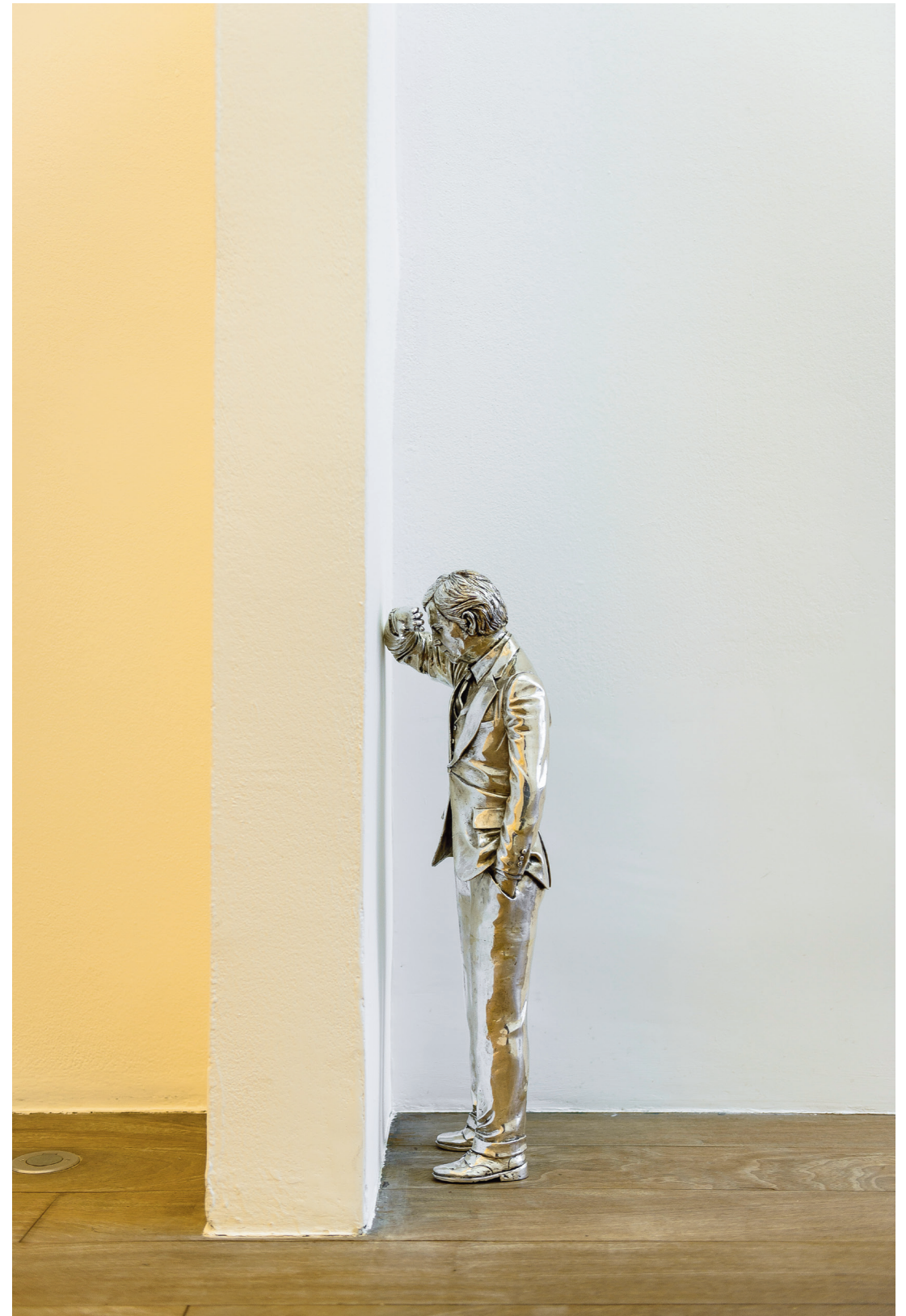
Silver Lamento , 2015 Plata. 60 cm aprox. Marfa Contemporary.