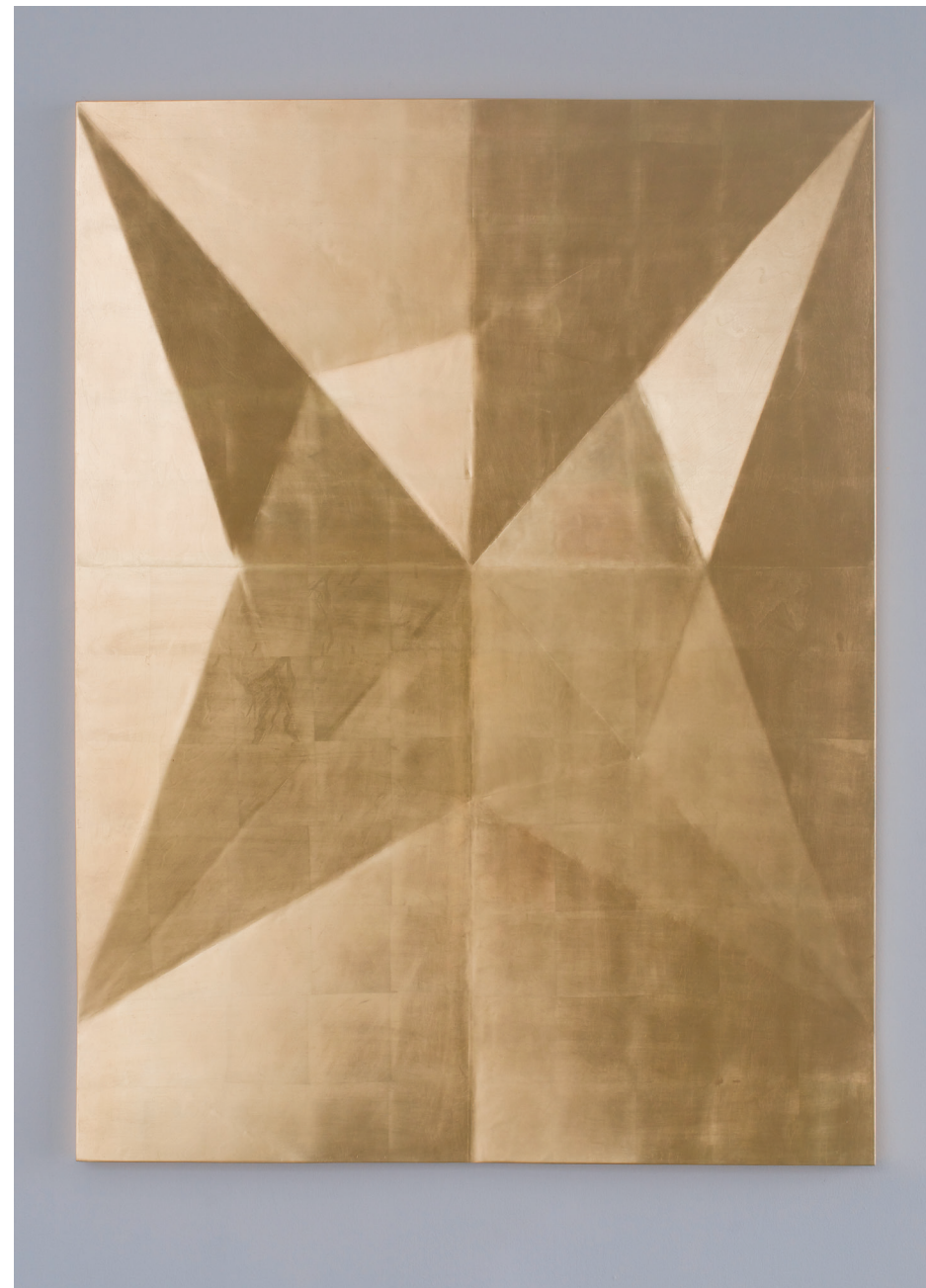
Unfolded Gold: Black eye , 2015 Madera y pan de oro. 190 x 150 cm. Colección del artista.