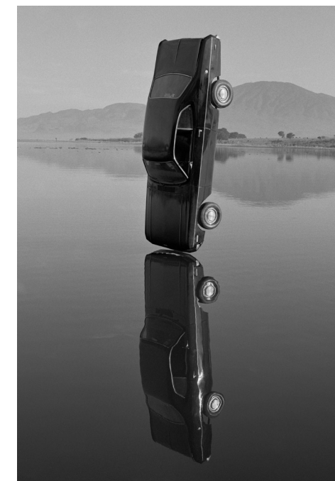
Entre la vida y la muerte B/N [Breve Historia del tiempo], 2008 Impresión fotográfica en blanco y negro. 180 x 120 cm.