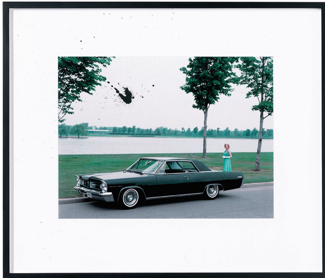
Dirty wish , 2007 Impresión digital y tinta china negra, 53 x 62 cm Colección particular.