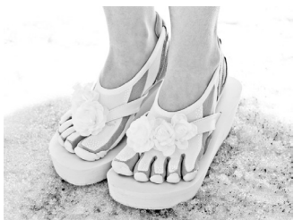
Zapatos en zapatos

Al principio, DIS era un mundo de tendencias falsas e historias especulativas. Creábamos imágenes con el único objetivo de etiquetarlas e “infiltrarlas” en Google. Imaginábamos tendencias de consumo, como llevar cuatro zapatos a la vez; por ejemplo bailarinas dentro de botas de la marca Teva. Lo llamamos