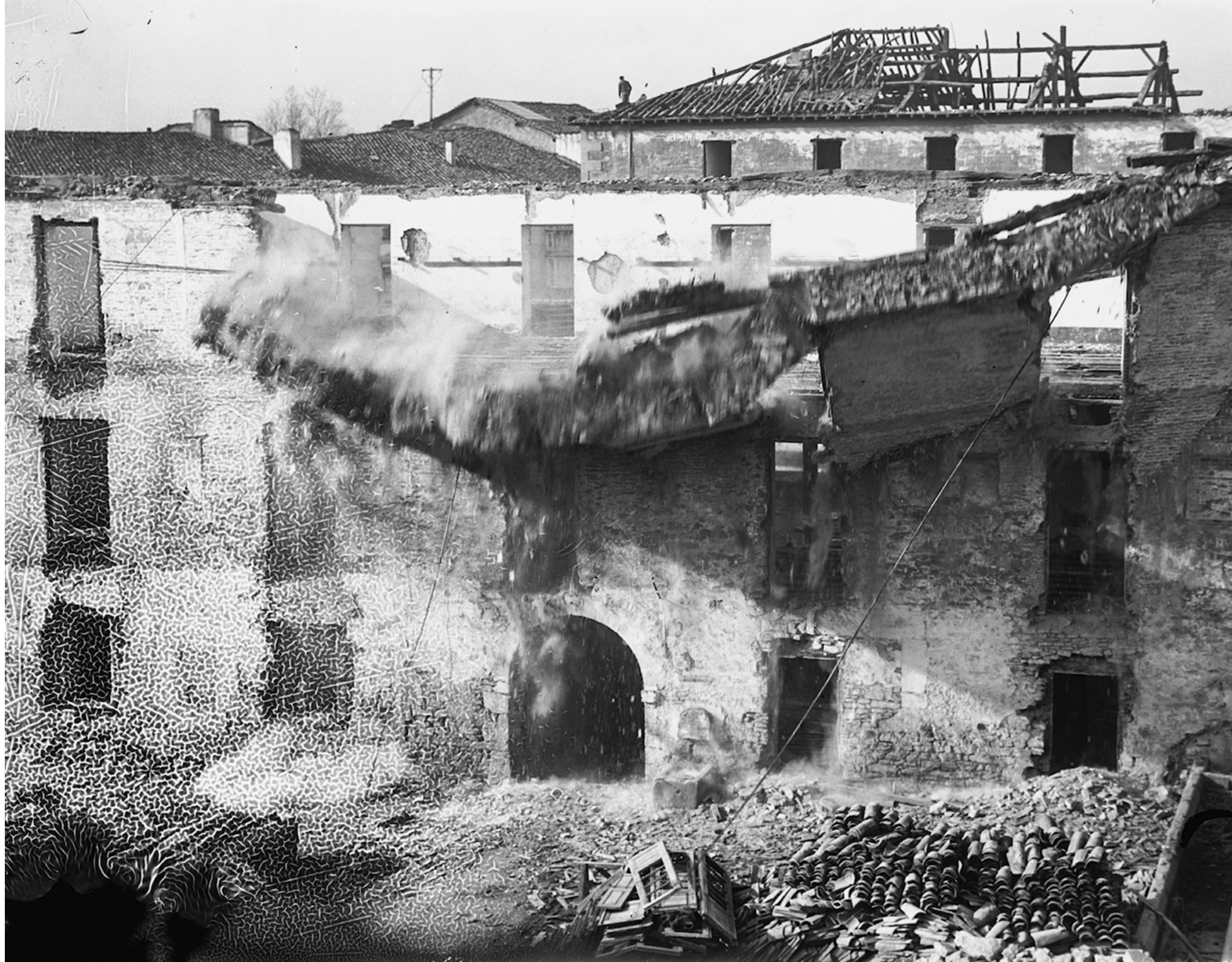
Begiak Hesteko Artean (In Ictu Oculi) (2020)