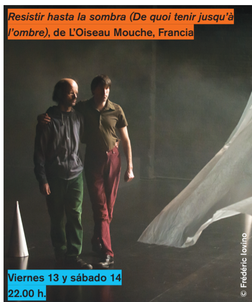
Resistir hasta la sombra (De quoi tenir jusqu'à l'ombre), de L'Oiseau Mouche, Francia