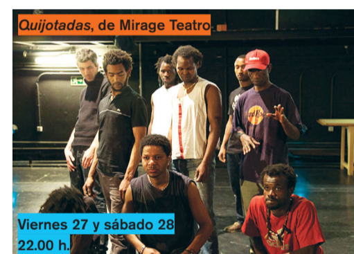
Quijotadas, de Mirage Teatro

Said , un niño marroquí, cruza el estrecho por casualidad. Al otro lado, se da cuenta de que la realidad no es como le habían contado. Coke Riobóo es músico, compositor y animador. Ha dirigido y animado tres cortometrajes, una serie para internet y varios proyectos comerciales. Ganador de un premio Goya por El Viaje de Said en 2006. Filmografía: El ruido del mundo (2013), cortometraje animado en plastilina sobre cristal, El viaje de Said (2006), 12:00, cortometraje de animación stop motion, La telespectadora (2001) cortometraje de animación stop motion.