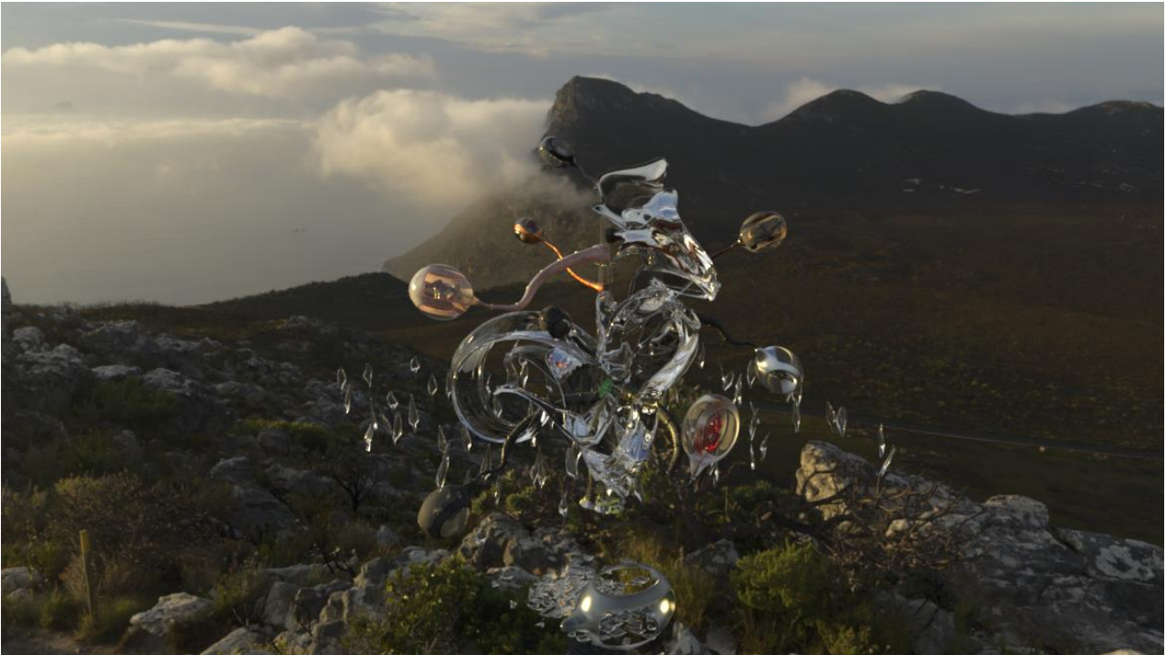
Electrónica en Abril 2022, imagen de Helin Sahin

Del jueves 31 de marzo al domingo 3 de abril