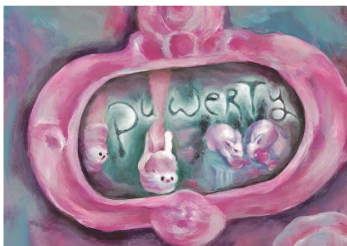
Diseño: Nuria López

El festival multidisciplinar de La Casa Encendida que reúne a creadores y artistas de menos de 26 años celebra su séptima edición. Bajo el lema 'Poder + pubertad', Puerty inicia un nuevo curso siendo el altavoz de los creadores y artistas jóvenes más interesantes en la creación contemporánea, musical y escénica.