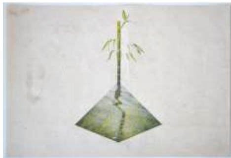
Quye [Árbol/Planta/Monte], 2015 Dibujo sobre papel 17 x 24 cm

También encontramos alusiones a objetos dorados, en este caso sumergidos, en el proyecto de Juan Zamora, titulado Cuerpos de agua . El artista parte del estudio de estas masas de agua natural que cubren parte de la Tierra y que en la cultura de comunidades indígenas de América del Sur, como la comunidad prehispánica muisca, eran lugares sagrados donde se realizaban rituales lanzando a sus profundidades objetos de oro que fabricaban, con la creencia de que así cobrarán vida. El artista realiza un trabajo sobre el propio terreno de los cuerpos de agua, explorando y recogiendo materiales orgánicos y objetos que encuentra como testimonios de la historia del lugar: hojas, piedras, fósiles, restos óseos, maderas, diminutos fragmentos de oro y tierra, etc